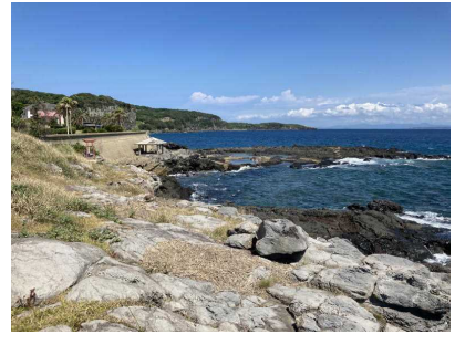
海水の自然プール付近