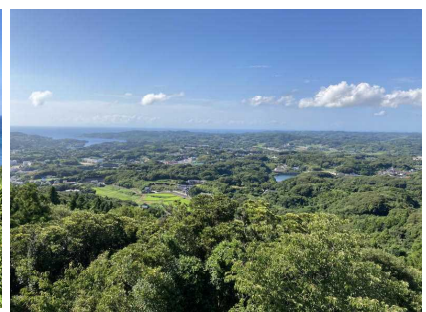
岳の辻からの眺望